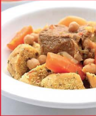
Boulettes de Semoule Kabyle Tiasbanine