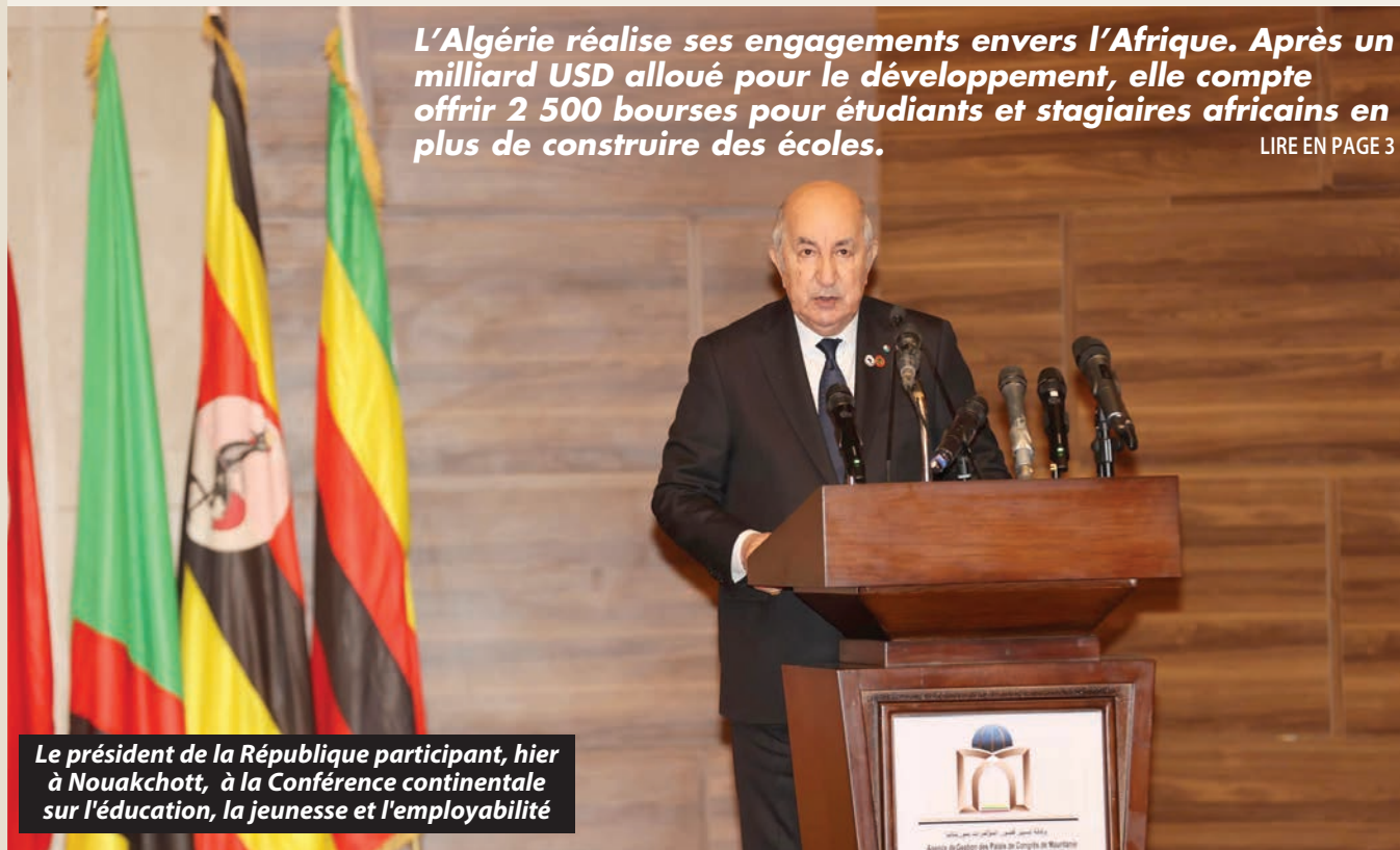
Le président de la République participant, hier à Nouakchott, à la Conférence continentale sur l'éducation, la jeunesse et l'employabilité