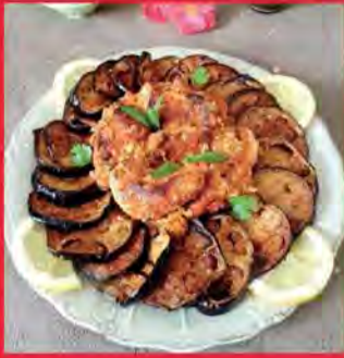
Barania ou Mderbel d'Aubergine