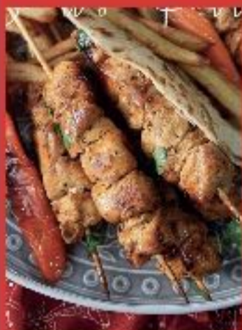
Brochettes de poulet aux épices indiennes