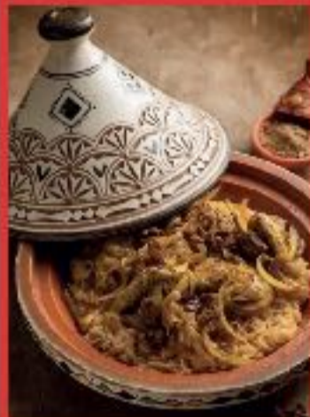
Tajine de Poulet aux Oignons et Raisins