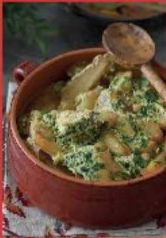
Kebab algerien au poulet