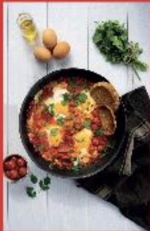
Chakchouka aux tomates cerise