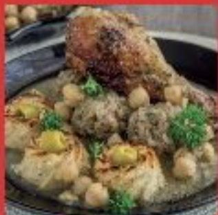
Tajine de chou fleur et boulettes de viande hachée