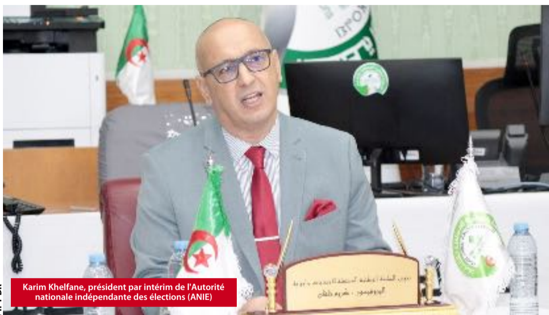
Karim Khelfane, président par intérim de l'Autorité nationale indépendante des élections (ANIE)

C'est ce qu'a fait savoir le président par intérim de l'Autorité nationale indépendante des élections (ANIE), Karim Khelfane, précisant que les statistiques font état de 937 jeunes candidats issus de 125 listes à travers les différentes wilayas du pays ayant bénéficié de l'aide de l'État destinée à couvrir les dépenses de campagne électorale des jeunes candidats se présentant au titre de listes indépendantes, âgés de moins de 40 ans le jour du scrutin, dans