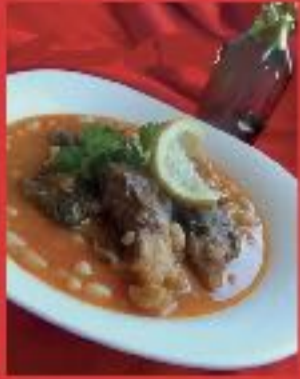
LOUBIA BEL KREWA3