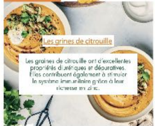
Les graines de citrouille

Les graines de citrouille ont d'excellentes propriétés diurétiques et dépuratives. Elles contribuent également à stimuler le système immunitaire grâce à leur richesse en zinc.