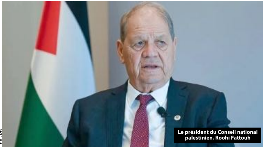
Le président du Conseil national palestinien, Roohi Fattouh

Le président du Conseil national palestinien, Roohi Fattouh, a salué l'initiative de 85 membres de la Chambre des représentants des États-Unis appelant l'administration du président américain, Donald Trump, à intervenir d'urgence pour mettre fin au projet colonial dit « E1 », à l'est d'El-Qods occupée.