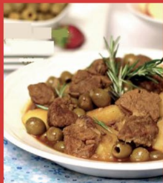
Pomme de terre aux olives