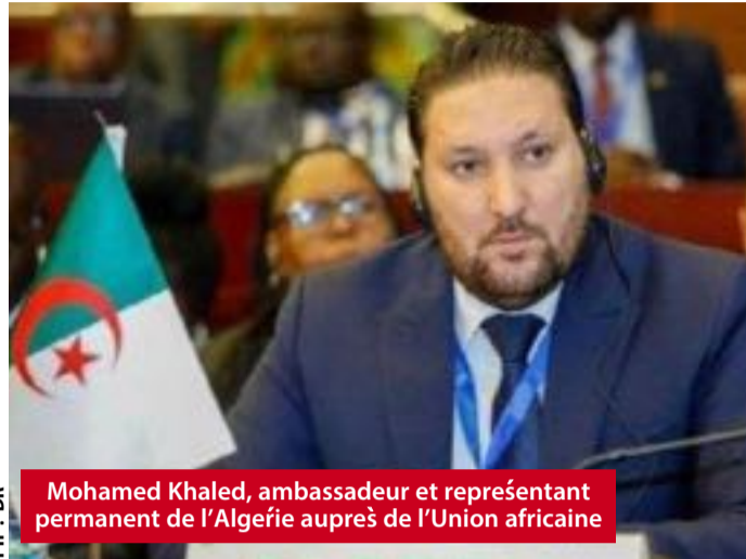
Mohamed Khaled, ambassadeur et représentant permanent de l'Algérie auprès de l'Union africaine

L'ambassadeur et représentant permanent de l'Algérie auprès de l'Union africaine (UA), Mohamed Khaled, a affirmé, à Addis-Abeba, que la criminalité transfrontalière organisée constitue une menace grandissante pour le continent africain, en raison de sa mutation en un système criminel interconnecté aux ramifications sécuritaires de plus en plus complexes.