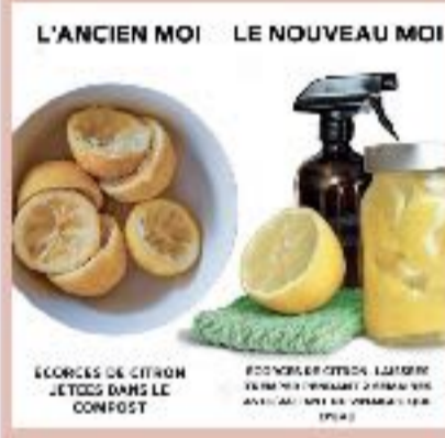
L'ANCIEN MOI LE NOUVEAU MOI ÉCORCES DE CITRON JETÉES DANS LE COMPOST ÉCORCES DE CITRON LAITIÈRE POUR UN SPRAY DÉTODORISANT