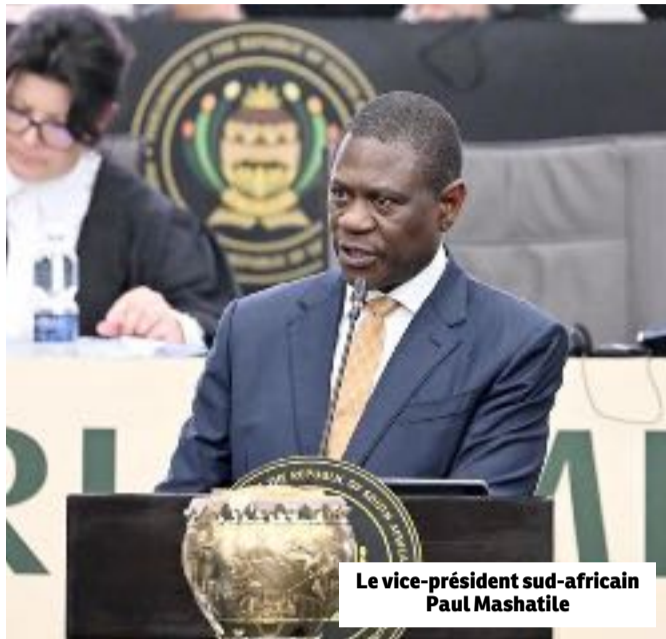
Le vice-président sud-africain Paul Mashatile

Le vice-président sud-africain Paul Mashatile a appelé jeudi à une intégration africaine plus poussée, à une industrialisation plus rapide et à une plus grande appropriation africaine du développement, alors que le continent célébrait les 25 ans du Nouveau Partenariat pour le développement de l'Afrique (NEPAD).