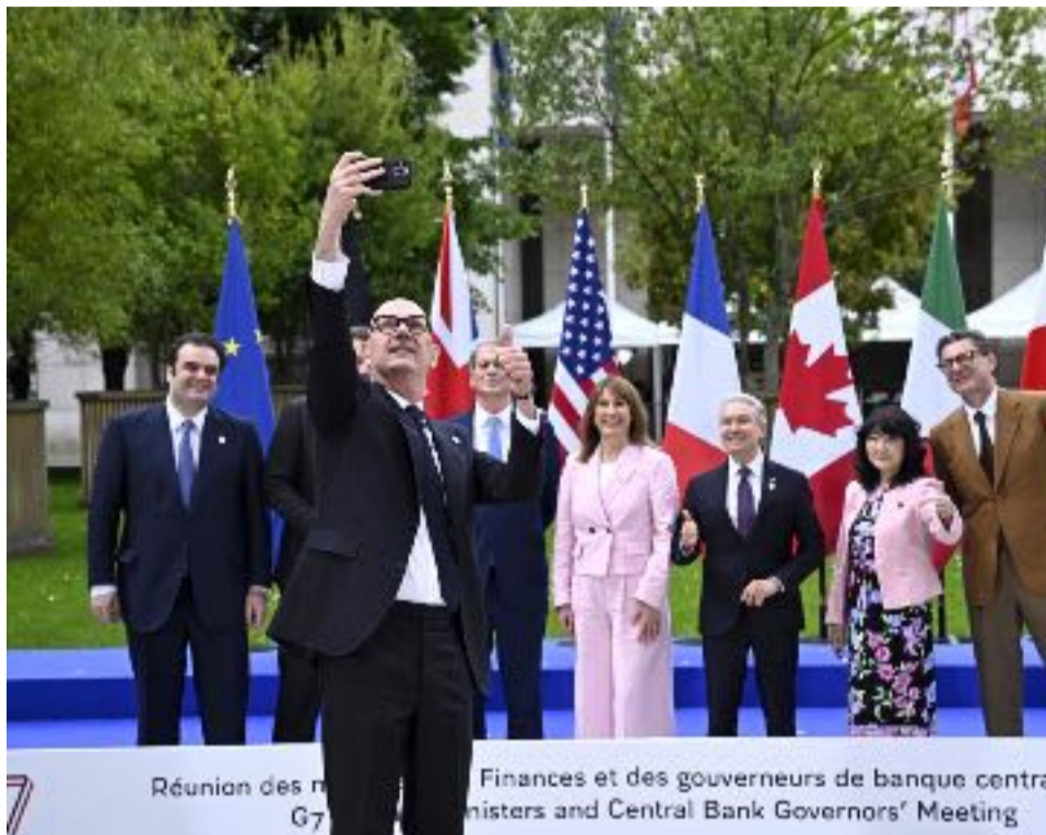
Réunion des ministres des Finances et des gouverneurs de banque centrale du G7 Ministers and Central Bank Governors' Meeting

« Aujourd'hui, on va montrer que le multilatéralisme, c'est utile et que ça fonctionne », a affirmé le ministre français de l'Économie et des Finances, Roland Lescure, à l'ouverture des travaux. Mais derrière cette volonté affichée d'unité, les fractures apparaissent de plus en plus nettement au sein du G7. Les tensions commerciales alimentées par les nouvelles surtaxes douanières imposées par Washington sous l'administration de Donald Trump compliquent les discussions. Plusieurs capitales européennes peinent à accepter ce durcissement américain, perçu comme une remise en cause des équilibres commerciaux entre alliés. Le Moyen-Orient au cœur des préoccupations Les conséquences économiques de la guerre au Moyen-Orient figurent parmi les priorités des discussions. Le blocage du détroit d'Ormuz suscite une vive inquiétude au sein des grandes économies industrialisées. Ce passage maritime straté-