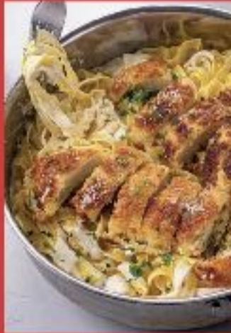
Poulet Crispy et Tagliatelles Alfredo