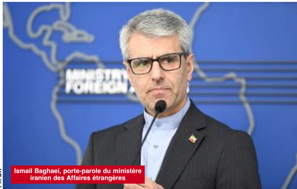
Ismail Baghaei, porte-parole du ministère iranien des Affaires étrangères

Il a ajouté : « C'est l'Amérique qui représente une menace pour la région et le monde », expliquant que les pays de la région « doivent pouvoir bénéficier d'une sécurité sans ingérence extérieure » et que « les pays du monde doivent se libérer de l'hégémonie américaine car Washington bafoue le droit international et ne se soucie pas des Nations unies ». L'Iran salue « toute initiative chinoise visant à mettre fin à la guerre. », a-t-il affirmé. La Chine a confirmé lundi la visite du président américain Donald Trump, prévue du 13 au 15 mai à l'invitation du président chinois Xi Jinping. Selon le ministère chinois des Affaires étrangères, il s'agira de la première visite d'un président américain en Chine depuis 2017.