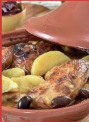
Tajine de poulet à la pomme de terre