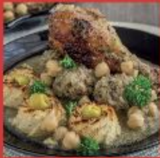
Tajine de chou fleur et boulettes de viande hachée