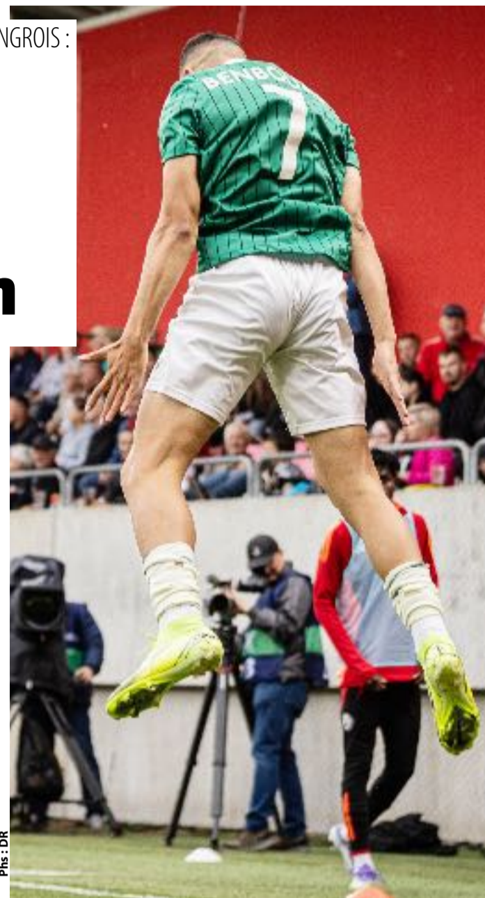
Plus : DR

La beauté de cette trajectoire réside aussi dans la récom-