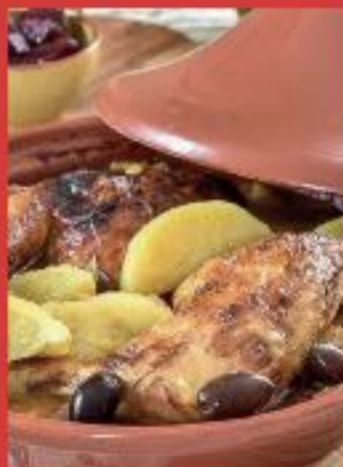
Tajine de poulet à la pomme de terre