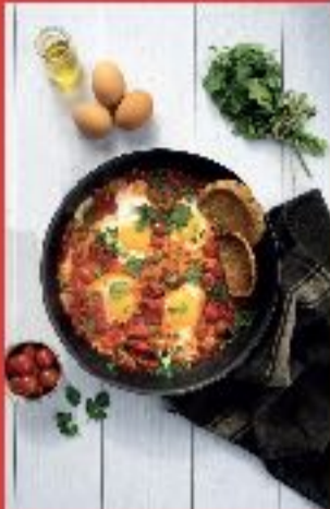
Chakchouka aux tomates cerise