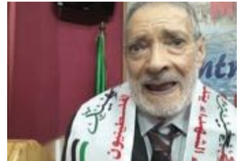
FIGURE EMBLÉMATIQUE DU JOURNALISME SPORTIF ALGÉRIEN