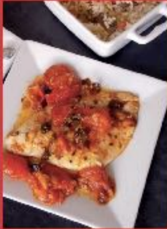
Sole au four aux herbes fines