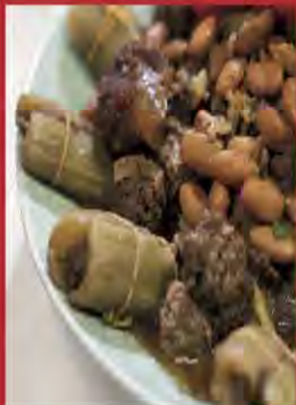
Loubia fsassa-cardons farcis