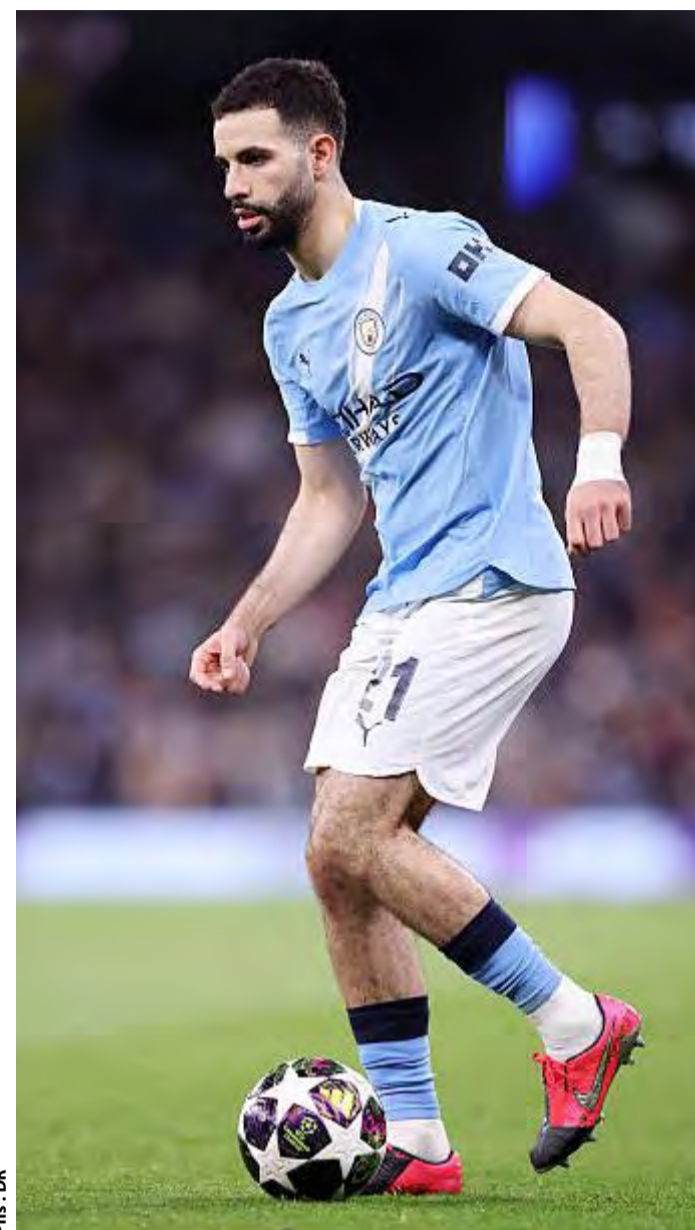
Phs : DF

Face à lui, des joueurs comme O'Reilly, plus décisifs récemment, gagnent en crédit auprès du staff technique, notamment grâce à leur effica-