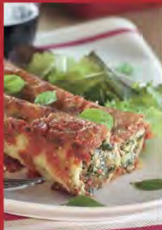
Cannelloni ricotta épinard et sauce tomate Mutti