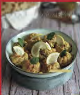
GRATIN DE CHOU FLEUR EN SAUCE