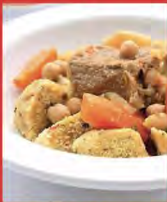
Boulettes de Semoule Kabyle Tiasbanine