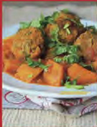
TAJINE D'AUBERGINE POTIRON & BOULETTES DE BOEUF