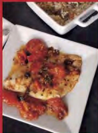
Sole au four aux herbes fines