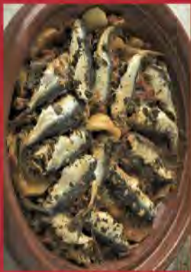
TAGINE DE SARDINES