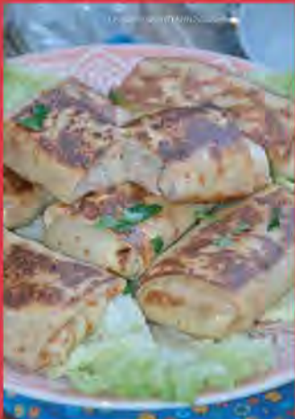
crêpes salées poulet champignons et béchamel