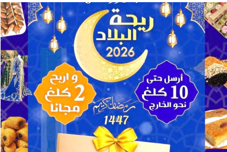
La promotion cible particulièrement les produits alimentaires et artisanaux algériens, tels que les gâteaux traditionnels, le frik, les dattes, les épices et autres saveurs locales emblématiques du mois sacré.

EMS Champion Post Algérie a annoncé, samedi dans un communiqué, le lancement d'une offre promotionnelle intitulée "Rihet L'Bled", spécialement dédiée au mois de Ramadan 2026, afin de faciliter les envois de colis internationaux pour ses clients. Cette initiative, devenue une tradition pour l'entreprise, vise à accompagner les citoyens durant cette période de partage en leur permettant d'envoyer des produits du terroir à leurs proches à l'étranger à des tarifs préférentiels. L'offre promotionnelle consiste en la gratuité de 2 kg pour tout envoi international dont le poids se situe entre 4 kg et 10 kg, précise le communiqué.