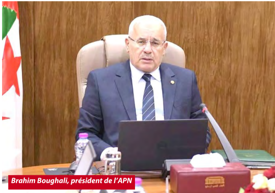
Brahim Boughali, président de l'APN

Dans ce contexte, il a mis en avant « l'importance des grands projets miniers, notamment ceux de Gara Djebilet, Oued Amizour et Blad El-Hadba », les qualifiant « de projets structurants de nature à renforcer l'économie nationale, soutenir le développement local, créer de la richesse et des emplois, et contribuer à l'augmentation du produit national brut ». Boughali a réaffirmé que « le caractère social de l'État demeure un choix stratégique constant », rappelant « l'attachement au principe de la gratuité de l'enseignement et des soins, ainsi que l'accompagnement de la politique de soutien à travers la lutte contre le gaspillage et la mauvaise gestion, afin de préserver les deniers publics et d'assurer la pérennité des acquis ».