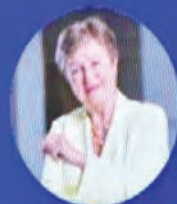
KRISTALINA GEORGIEVA Managing Director, IMF