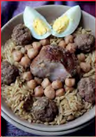
Tliltli (langues d'oiseaux)