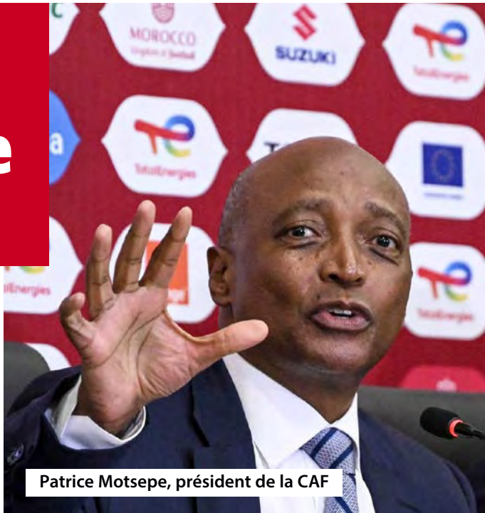
Patrice Motsepe, président de la CAF