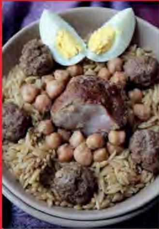
Tiltli (langues d'oiseaux)