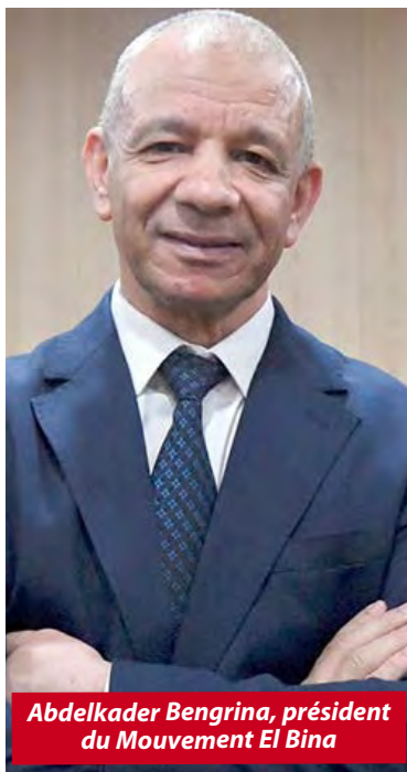
Abdelkader Bengrina, président du Mouvement El Bina