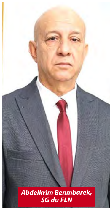
Abdelkrim Benmbarek, SG du FLN