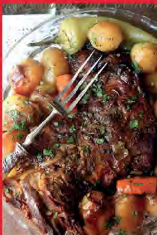
Gigot d'agneau au four