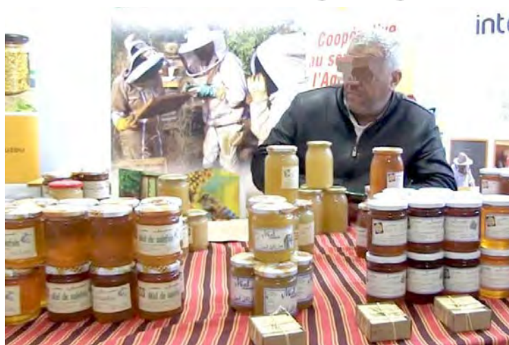
miel de la région, et de faire découvrir au consommateur les

Cette manifestation, qui se poursuivra jusqu'au 11 janvier prochain, est organisée par la Coopérative agricole polyvalente de Tizi-Ouzou (CAPTO) sous le slogan : "La ruche, une richesse biologique à promouvoir". Le but de cette foire est à la fois d'offrir un espace de commercialisation aux producteurs de