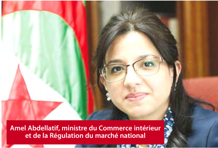
Amel Abdellatif, ministre du Commerce intérieur et de la Régulation du marché national

La ministre du Commerce intérieur et de la Régulation du marché national, Amel Abdellatif, a souligné que l'investissement n'atteint son véritable impact économique que s'il est intégré dans un système intégré de production et de commercialisation, insistant sur le rôle central de son ministère dans la régulation de la relation entre la production, la distribution et la consommation, et la garantie de la stabilité et de l'équilibre du marché.