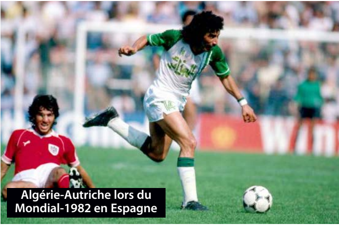
Algérie-Autriche lors du Mondial-1982 en Espagne

Cette rencontre demeure une référence quant au potentiel offensif des Verts face à un géant