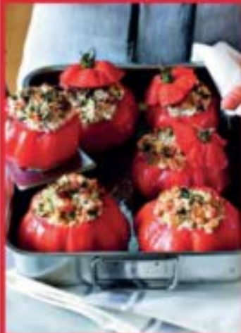
Tomates farcies à l'italienne