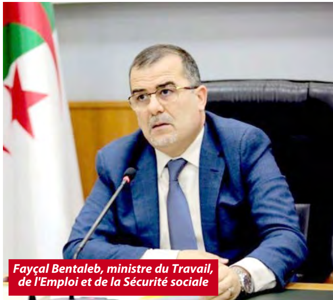
Fayçal Bentaleb, ministre du Travail, de l'Emploi et de la Sécurité sociale

Le ministre du Travail, de l'Emploi et de la Sécurité sociale, Fayçal Bentaleb, a affirmé que les efforts déployés par l'Algérie dans le domaine de la promotion de l'emploi et de la lutte contre le chômage avaient contribué à réaliser des progrès notables dans le domaine du développement durable, a indiqué un communiqué du ministère.