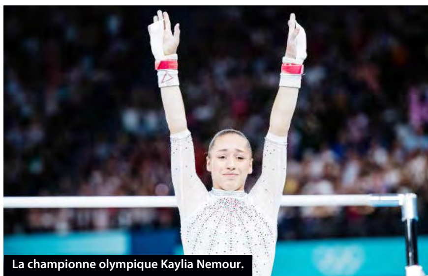
La championne olympique Kaylia Nemour.

seulement 18 ans, est considérée comme la star montante de la gymnastique artistique féminine mondiale. Pour preuve, dès sa première sortie,