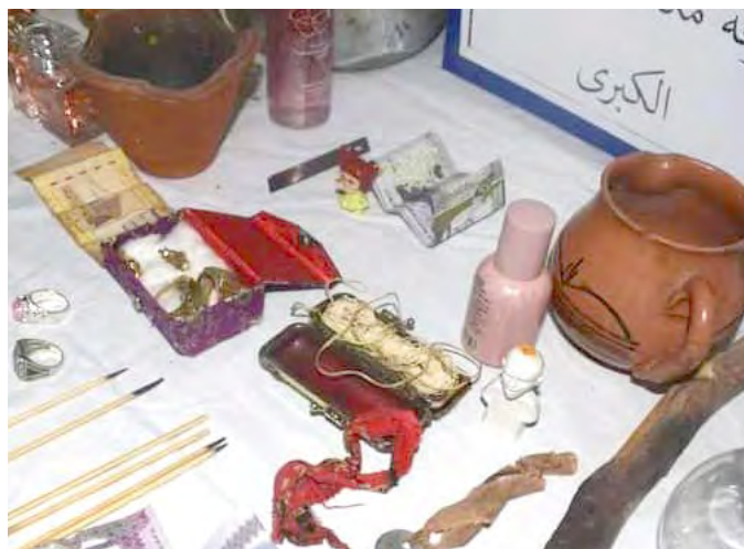
individu dénommé (Y.S.), en flagrant délit de pratique d'actes de sorcellerie et de charlatanisme. Une série d'objets utilisés à cet effet, des sommes d'argent impor-

Le tribunal de Batna a ordonné le placement en détention provisoire de six individus pour délit de pratique de sorcellerie et de charlatanisme, indique lundi un communiqué du parquet de la République près le même tribunal. "En application des dispositions de l'article 11 du Code de procédure pénale, le parquet de la République près le tribunal de Batna informe l'opinion publique que, dans le cadre de la lutte contre les différentes formes de criminalité, notamment celles portant atteinte aux valeurs religieuses et morales, qu'en date du 09 avril 2025, il a été procédé à l'arrestation d'un