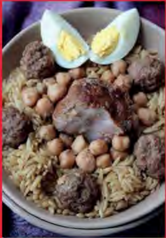
Tliltli (langues d'oiseaux)