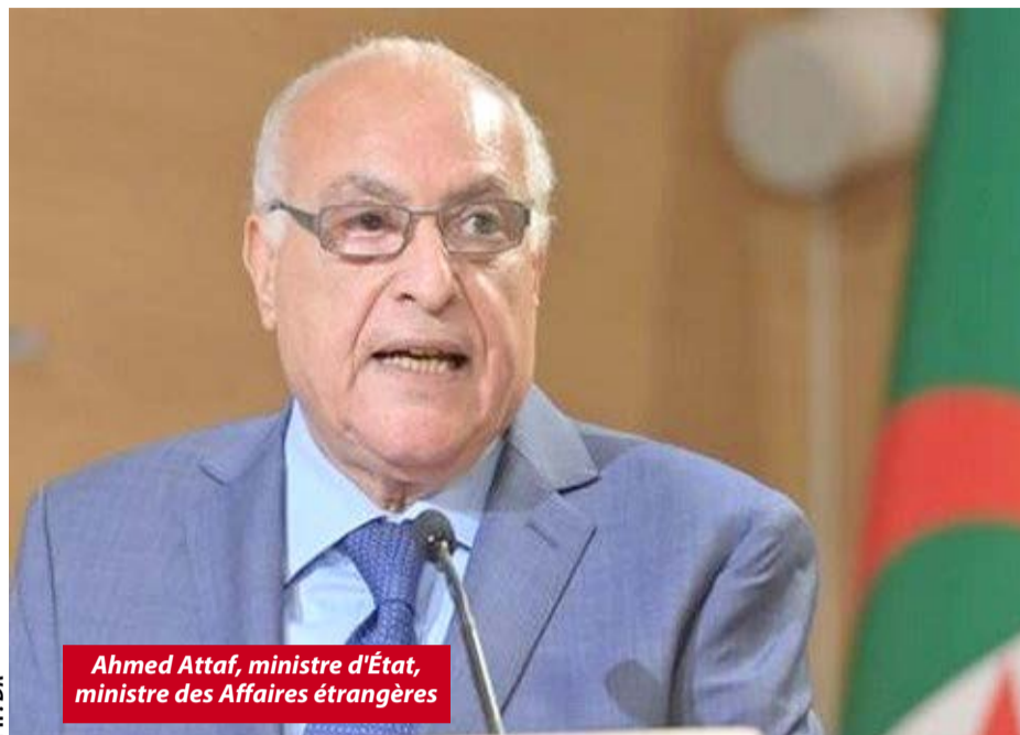
Ahmed Attaf, ministre d'État, ministre des Affaires étrangères

L'Algérie est disposée à apporter à la Représentante spéciale du Secrétaire général des Nations unies et Cheffe de la Mission d'appui des Nations unies en Libye (MANUL), Mme Hanna Serwaa Tetteh, toutes formes de soutien et d'appui dans l'accomplissement de sa noble mission.