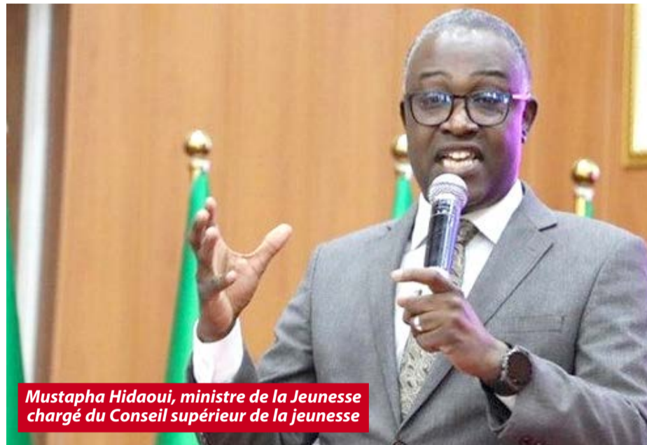
Mustapha Hidaoui, ministre de la Jeunesse chargé du Conseil supérieur de la jeunesse

Selon le ministre, «les modèles futurs des établissements de jeunes qui seront réalisés à l'avenir seront modernisés et constitueront un espace ouvert en phase avec les nouveaux choix des jeunes et les services supplémentaires qu'ils demandent». La même source a ajouté que, «l'objectif est d'en faire une destination où ils peuvent passer leur temps, pratiquer leurs loisirs et développer leurs compétences, et ce, en application des aspirations du secteur visant à renforcer l'attractivité de l'établissement de jeunesse». Grâce aux établissements de jeunes, a souligné M. Hidaoui, «il est possible de renforcer la sensibilisation aux convictions nationales, notamment la citoyenneté, la citoyenneté numérique, le sens civique, l'esprit national et la préservation de la mémoire nationale». D'autre part, le ministre a affirmé que «sa visite aux structures dédiées aux jeunes à Blida lui a permis de prendre connaissance d'un modèle prometteur des efforts consentis par les cadres du secteur pour attirer les