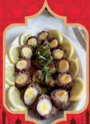
Kefta aux Oeufs (Memou fi hdjer Omou)