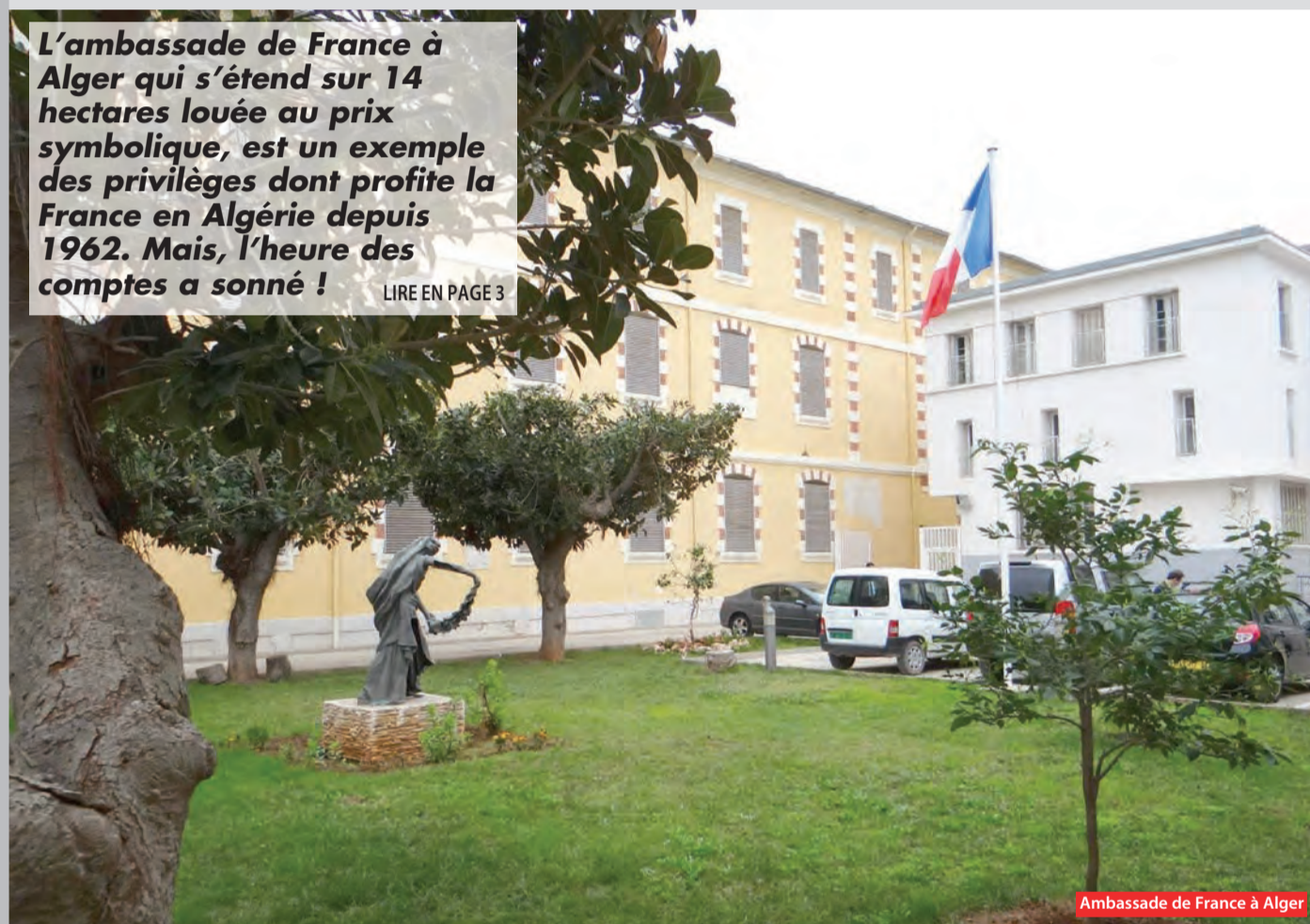
Ambassade de France à Alger