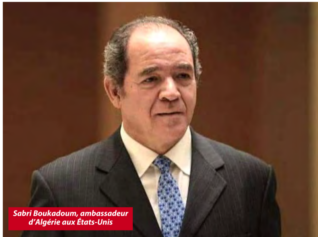
Sabri Boukadoum, ambassadeur d'Algérie aux États-Unis

Les mêmes sources indiquent que Sabri Boukadoum a également évoqué les objectifs de l'Algérie de renforcer ses liens sécuritaires et économiques avec les États-Unis au cours de la deuxième administration Trump et les opportunités émergentes de collaboration en matière de technologie de défense. Il a rappelé que la coopération militaire entre Alger et Washington repose sur un cadre juridique défini par un mémorandum d'entente, qui a ouvert la voie à de multiples opportunités dans le domaine de la sécurité. Selon les mêmes sources Sabri Boukadoum a également évoqué les objectifs de l'Algérie de renforcer ses liens sécuritaires et économiques avec les États-Unis au cours de la deuxième administration