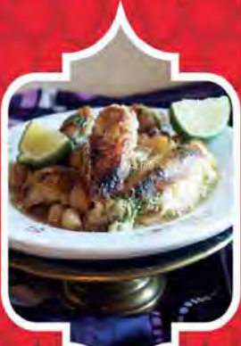
Khdawedj ala derbouz