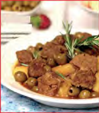
Pomme de terre aux olives