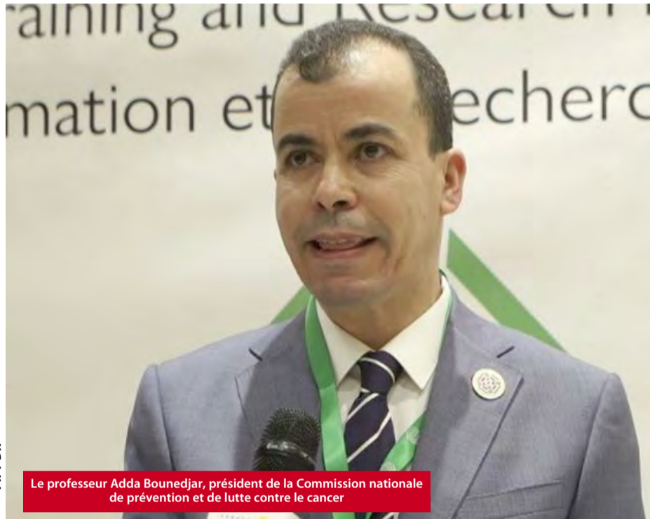
Le professeur Adda Bounedjar, président de la Commission nationale de prévention et de lutte contre le cancer

À cette occasion, 22 comités ont été mis en place afin de renforcer les efforts en matière de prévention, de dépistage et d'amélioration de la prise en charge des patients atteints de cancer. La cérémonie d'installation s'est tenue à l'occasion de la Journée mondiale contre le cancer, en présence du ministre de la Santé, Abdelhak Saihi, ainsi que du ministre du Travail, de l'Emploi et de la Sécurité sociale. Notant que cette commission, placée auprès du Président de la République, est chargée notamment de «proposer les éléments de la stratégie nationale de prévention, de lutte, de suivi et d'évaluation du cancer, d'assurer la coordination et le suivi des activités du plan national de prise en charge des patients atteints du cancer et son évaluation». Elle a, aussi, pour mission de «renforcer les mesures de pré-