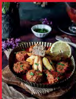
boulettes de sardines