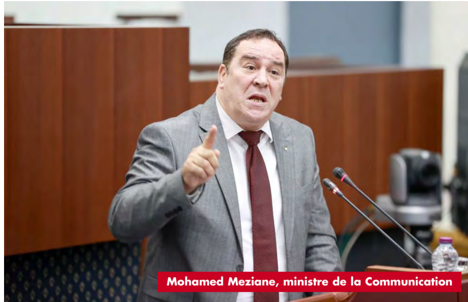
Mohamed Meziane, ministre de la Communication

à près de 95% ». La promotion des médias régionaux «s'inscrit dans le cadre de la mise en œuvre des orientations du président de la République, Abdelmadjid Tebboune, visant à asseoir des médias professionnels et compétitifs, consacrant le droit du citoyen à accéder à une information fiable et accompagnant le développement national global», a expliqué Meziane. Il a, par ailleurs, mis en avant les efforts consentis pour développer le secteur de l'information, notamment à travers plusieurs « projets ambitieux », à l'instar de la cité médiatique DZAIR Media CITY, précisant que ce projet, « qui vise à promouvoir le secteur audiovisuel en Algérie, constitue une infrastructure intégrée regroupant les principaux acteurs du domaine ». Et d'ajouter que cette infrastructure offrira «une transmission instantanée garantissant la diffusion via les plateformes technologiques les plus modernes, avec un grand centre de données basé sur