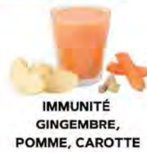
IMMUNITÉ GINGEMBRE, POMME, CAROTTE