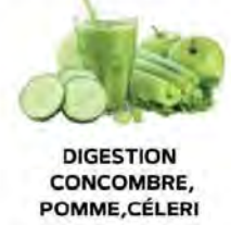
DIGESTION CONCOMBRE, POMME, CÉLÉRI