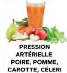
PRESSION ARTÉRIELLE POIRE, POMME, CAROTTE, CÉLÉRI