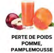
PERTE DE POIDS POMME, PAMPLEMOUSSE