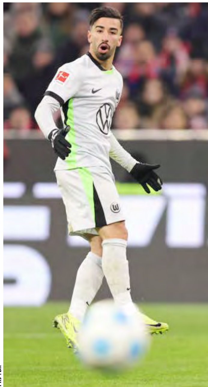
P.H.S. : DP

arabes dans différents championnats européens est due à leur provenance de championnats où la formation tactique est moins avancée, ce qui représente un obstacle pour les attaquants issus des académies européennes, leur laissant ainsi une grande marge de progression. De plus, ces joueurs conservent un talent inné pour le but et la création de jeu.